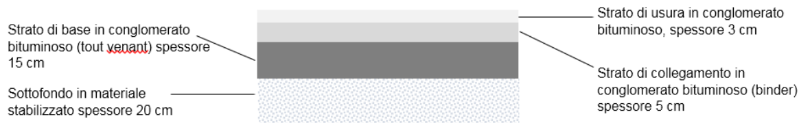
Figura 7.1 – Sezione pavimentazione

La sezione della pavimentazione prevista è riportata nella figura che segue.