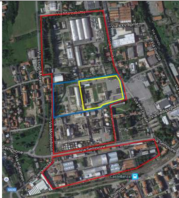
Figura 2.1 Polo chimico ex Montedison di Castellanza – Olgiate Olona. Ubicazione Sub area BH16 Immagine da satellite In rosso area Chemisol – In blu Zona C – In giallo Sub area BH16