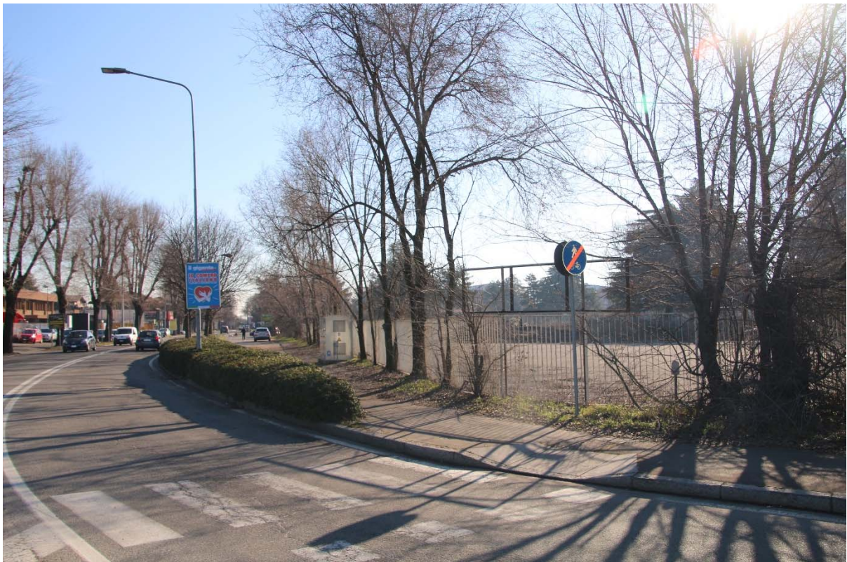
VIALE BORRI- ROTATORIA CON VIALE PIEMONTE