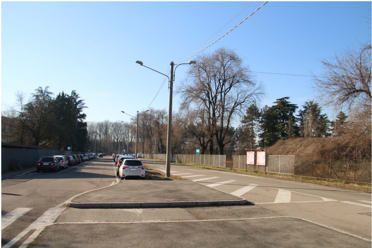
VIA AZIMONTI- ASSE ISTITUTO SUPERIORE