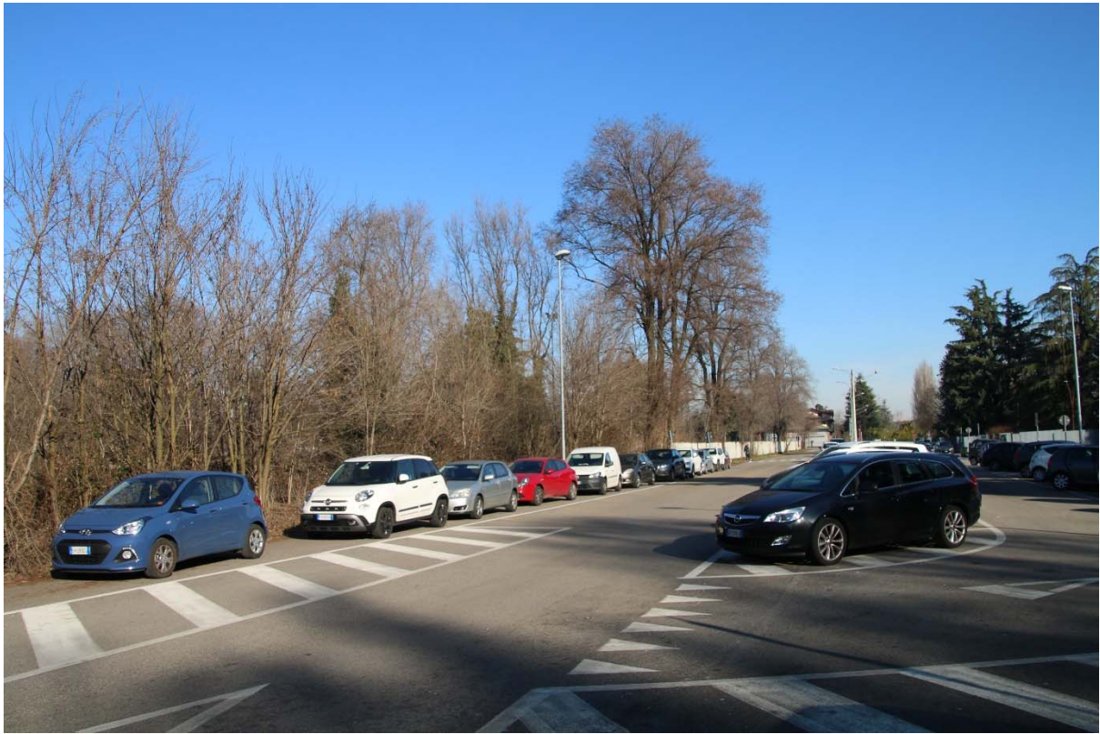
VIA AZIMONTI ASE ISTITUTO SUPERIORE