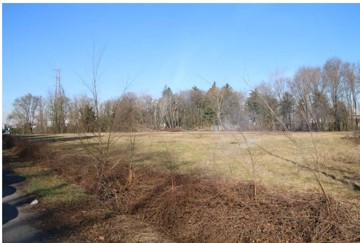
AREA DI PROPRIETA' COMUNALE