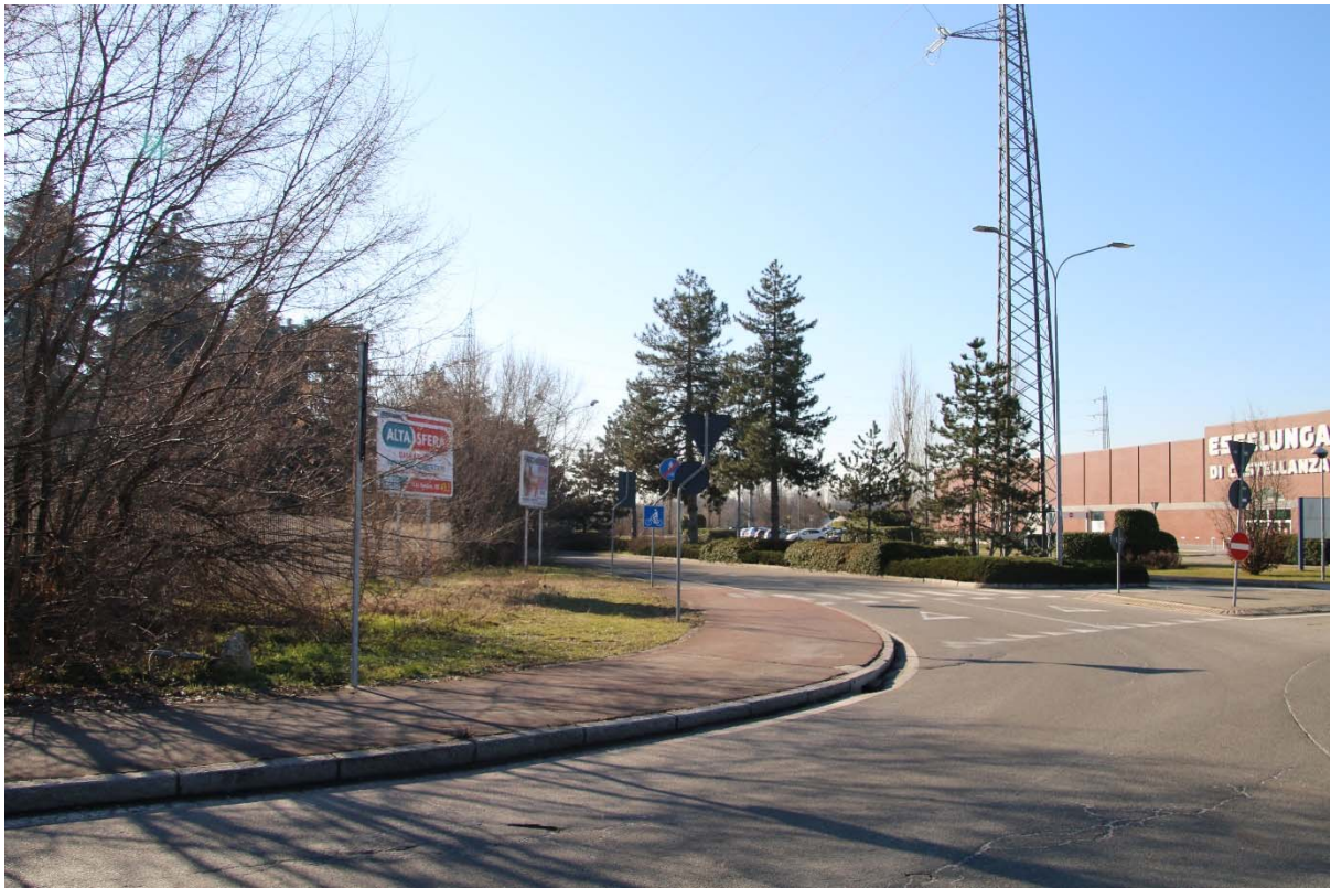
VIALE BORRI- ROTATORIA CON VIALE PIEMONTE