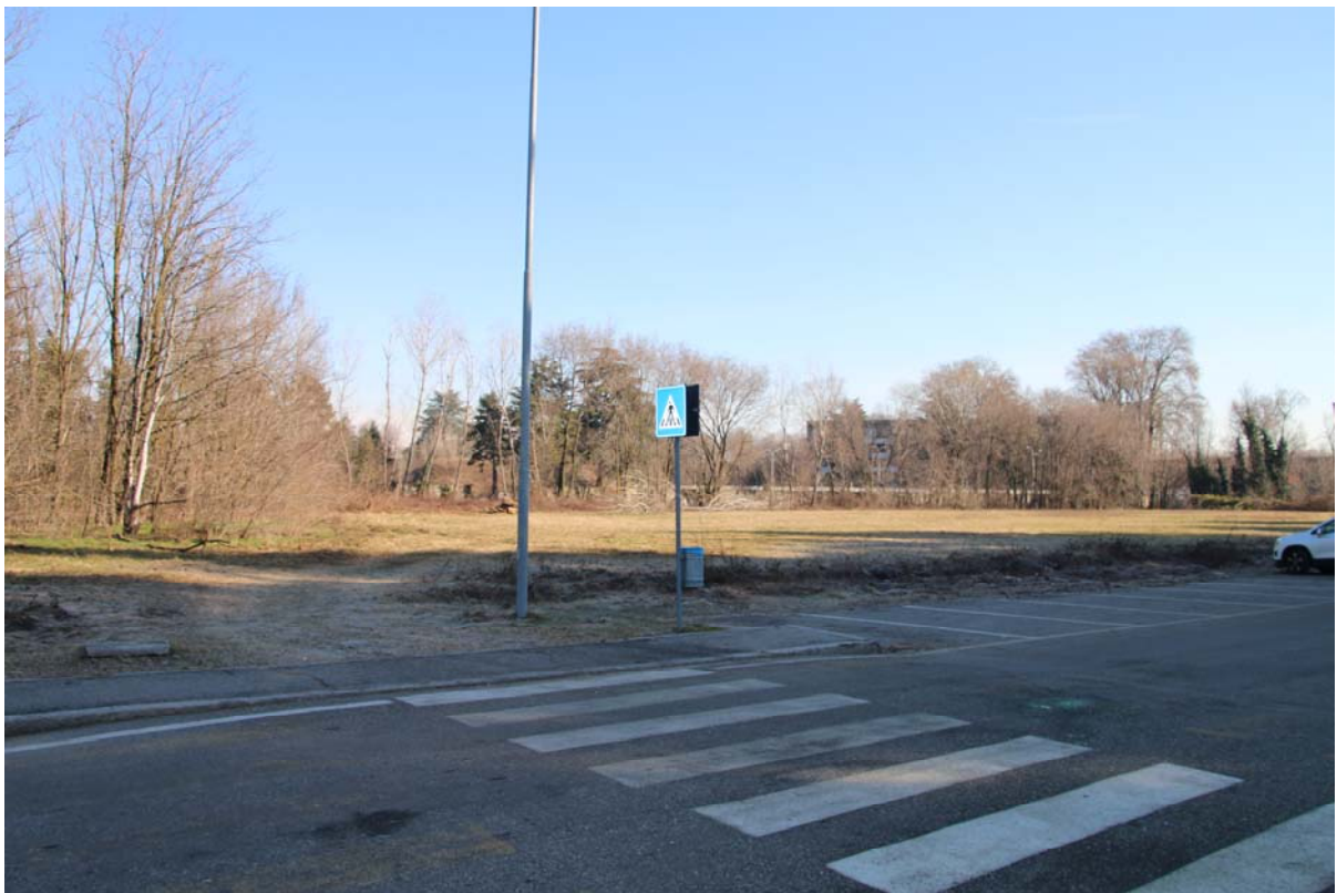
AREA DI PROPRIETA' COMUNALE A SUD DELL'AMBITO