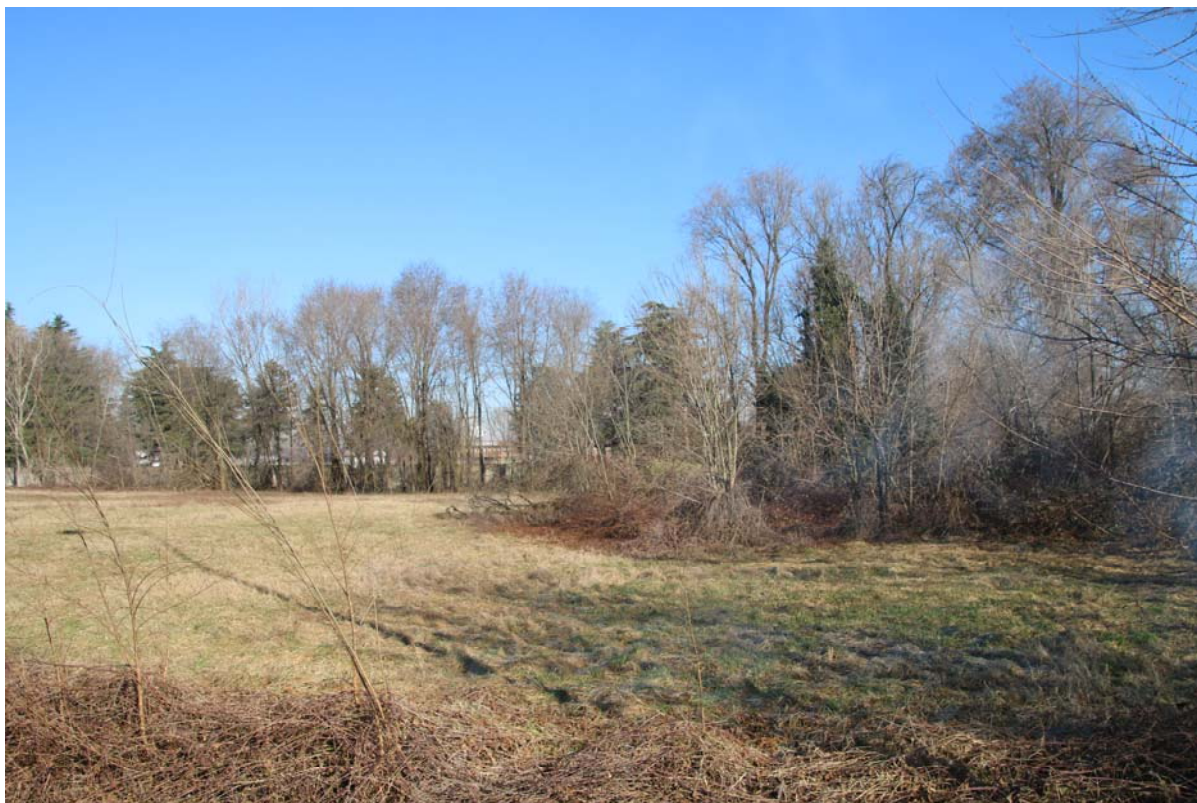
AREA DI PROPRIETA' COMUNALE