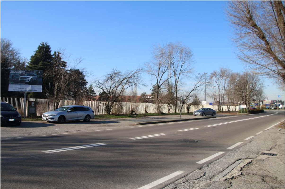
RECINZIONE DI PROPRIETA' SU VIALE BORRI