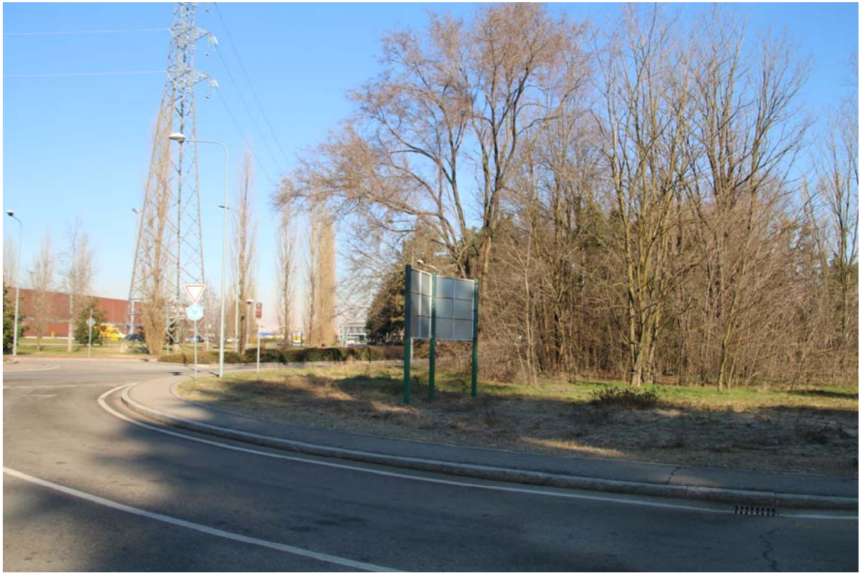
ANGOLO TRA VIALE PIEMONTE E VIA AZIMONTI ASSE PARCO ALTO MILANESE