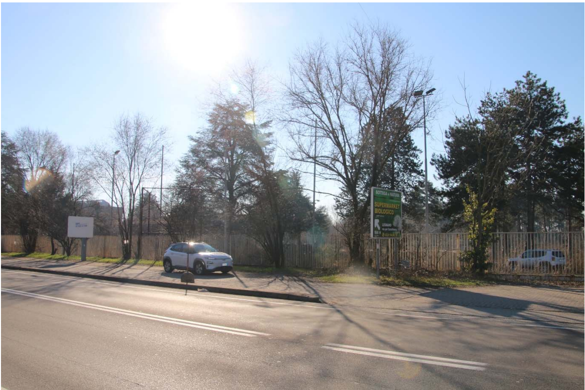
RECINZIONE DI PROPRIETA' SU VIALE BORRI