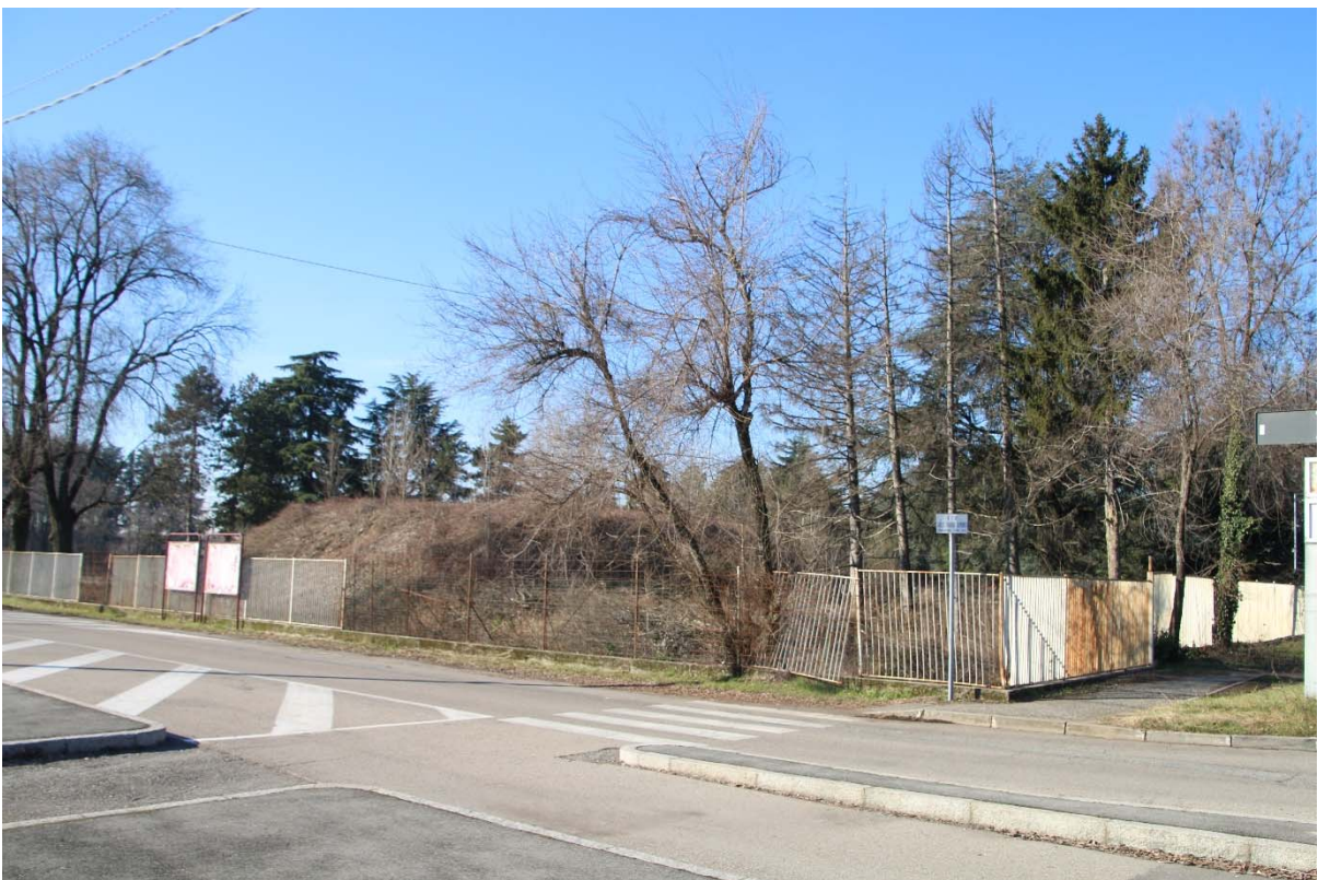
INCROCIO TRA VIALE BORRI E VIA AZIMONTI