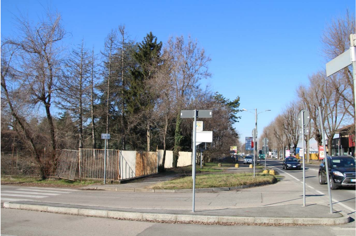
INCROCIO TRA VIALE BORRI E VIA AZIMONTI