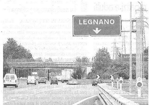
Lo svincolo autostradale di Legnano

Costanti aggiornamenti sulla situazione della viabilità e sui percorsi alternativi sono comunque diramati tramite i notiziari "my way" in onda sul canale 501 di Sky Meteo24; su Rtl 102.5; su Isoradio 103.3, ma anche su i pannelli a messaggio variabile e sul network Tv Infomoving in Area di Servizio. Per ulteriori informazioni sulle chiusure è possibile chiamare il call center di Autostrade al numero 840.04.21.21.