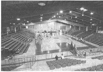
Il PalaBorsani di Castellanza - qui una spettacolare veduta nella nuova versione - ha accolto ieri il primo allenamento dell'Europromotion Legnano (Pubblicato)