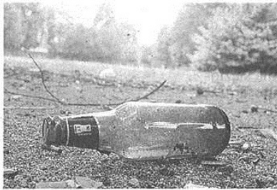
Bottiglie rotte nei parchi dei bambini

per il suo monumento) e in quello di via Italia non sono state trovate deiezioni canine. «Sarà un caso oppure si provveduto a pulire tutto per tempo – replicano, provocatoriamente, i genitori – Fatto sta che di frequente capita di imbattersi negli escrementi, segno che si dovrebbero fare più controlli per far rispettare l'ordinanza». Le lamentele, comunque,