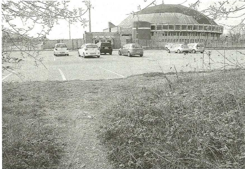
Il sentiero approda al parcheggio del Palayamamay, la lista di minoranza propone la messa in sicurezza