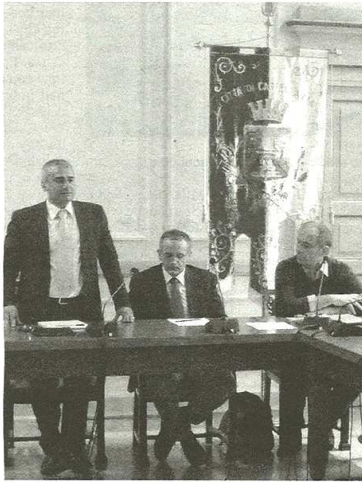
Uno dei momenti dell'assemblea pubblica sui rifiuti

DATI – Il metodo scelto per erogare i rimborsi è quello dei contributi a copertura di una quota della Tares per chi pagato un aumento tariffario rispetto alla Tassa smaltimento rifiuti solidi urbani del 2012. Altro dato rilevante è che 3mila 920 euro sono andati alle utenze domestiche (nuclei familiari con cinque o più componenti), mentre 79mila 701 sono stati destinati alle utenze non domestiche (imprese e commercianti). «I contributi – rende noto Palazzo Brambilla – sono stati erogati a seguito delle richieste pervenute in comune entro la data dello scorso 18 febbraio». Singolare è che, a fronte dei 20mila euro messi a disposizione per i rimborsi delle famiglie, ne sono stati