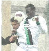
Non è bastato il gol di Ba a salvare la Castellanzese col Portichetto

Note: terreno in buone condizioni. Spettatori circa 100. Ammonizioni: Lacay K., Cozzoli. Angoli: 4 a 3. Recupero: 2' + 4'.