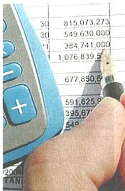
Nuove regole per i bilanci

Il suo caso aziendale ne è un esempio: «In dieci anni siamo passati da piccola azienda a media azienda, ma siamo certificati da Kpmg fin dal primo bilancio. Trasparenza e rispetto delle regole sono nelle nostre corde». Ecco perché è sua convinzione che «il sistema delle regole non dovrebbe essere un ostacolo, mentre l'armonizzazione è un vantaggio. Poi il rapporto fiduciario con i commercialisti è la garanzia che le