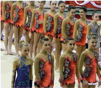
Le atlete premiate durante il saggio di Natale

Al Palaborsani il saggio "Bianco Natale" è stata occasione di festa per centinaia di piccole atlete