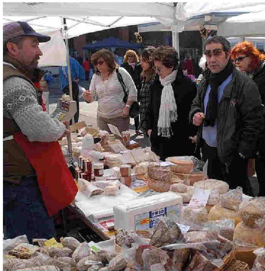
Sconti tares alle associazioni e enti che lavorano nel sociale anche organizzando mercatini

SCONTI - Serpeggiano malumori, fra i gruppi associativi di volontariato, per l'obbligo di pagare la Tosap in caso di manifestazioni aggregative: «La reputiamo un'ingiustizia, perché noi non lavo-