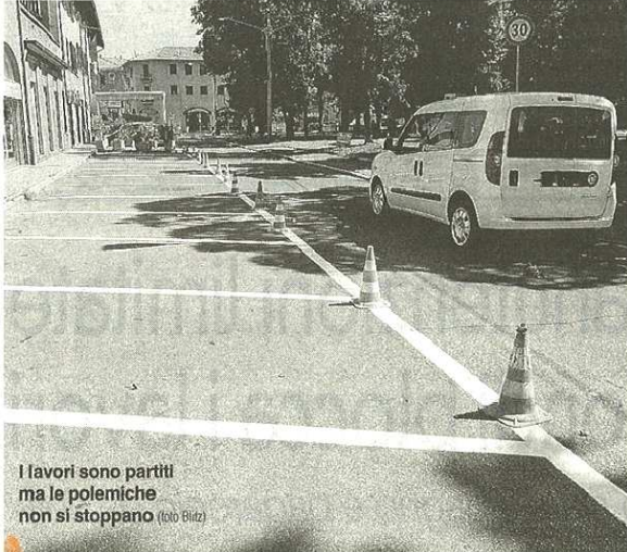
I lavori sono partiti ma le polemiche non si stoppano