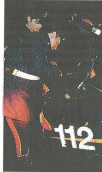
Indagano i carabinieri di Busto

In pochi attimi hanno compiuto la razzia di soldi. Ma evidentemente non paghi del bottino appena arraffato, hanno portato via anche alcuni computer in dotazione al personale amministrativo. Dopo aver completato