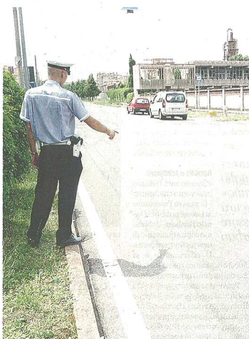
I rilievi dei vigili: sull'asfalto l'inutile frenata del Suv VARESEPRESS

Nei pressi del cimitero il ragazzo avrebbe invaso la carreggiata venendo travolto