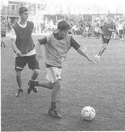
I ragazzi sono impegnati con entusiasmo

Voglia di riunirsi e sana competizione. Ultime gae e giochi