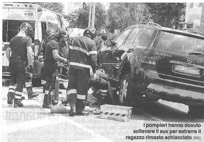
I pompieri hanno dovuto sollevare il suv per estrarre il ragazzo rimasto schiacciato (BIRIZ)