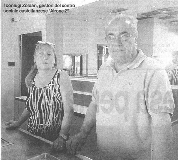
I coniugi Zoldan, gestori del centro sociale castellanese "Airone 2"

Airone 2 sgombera: tanta gente adesso non saprà dove andare