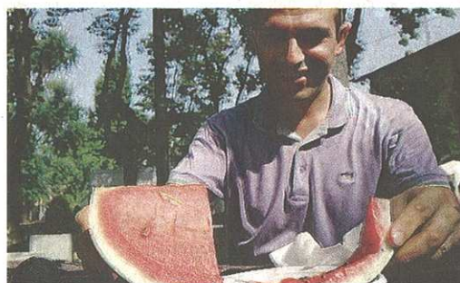
Un'immagine dell'ultima edizione della festa dell'anguria

Quello che non mancherà sarà invece il rosario in piazza Castegnate presso la stele di San Bernardo. «Questa tradizione abbiamo deciso di portarla avanti - dice il presidente della Pro Loco - si svolgerà la sera del 20 agosto». ■ M. Por.