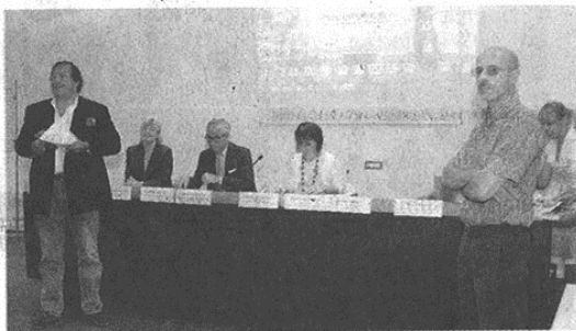
Presentazione dei nuovi corsi Ists: il sindaco di Castellanza Fabrizio Farisoglio (a destra) con il sindaco di Busto Arsizio Gigi Farioli

CASTELLANZA (esl) Formare i giovani per investire in un settore storicamente importante per il territorio: è l'idea che sta dietro ai due percorsi formativi dell'Isis Facchinetti. Le specializzazioni proposte saranno di «Tecnico Superiore per il coordinamento dei processi di progettazione, comunicazione, marketing della moda» e «Tecnico Superiore di processo e prodotto per la nobilitazione degli articoli tessili». Promossi dalla Fondazione Cosmo sono stati presentati davanti ai sindaci di Castellanza, Fabrizio Farisoglio , e di Busto Arsizio, Gianluigi Farioli . Si tratta di percorsi biennali completi di stage aziendale, accessibili a chi, in possesso di un diploma di maturità, desidera sviluppare competenze in ambito tessile. «Gli istituti tecnici non sono scuole di serie B - ha commentato