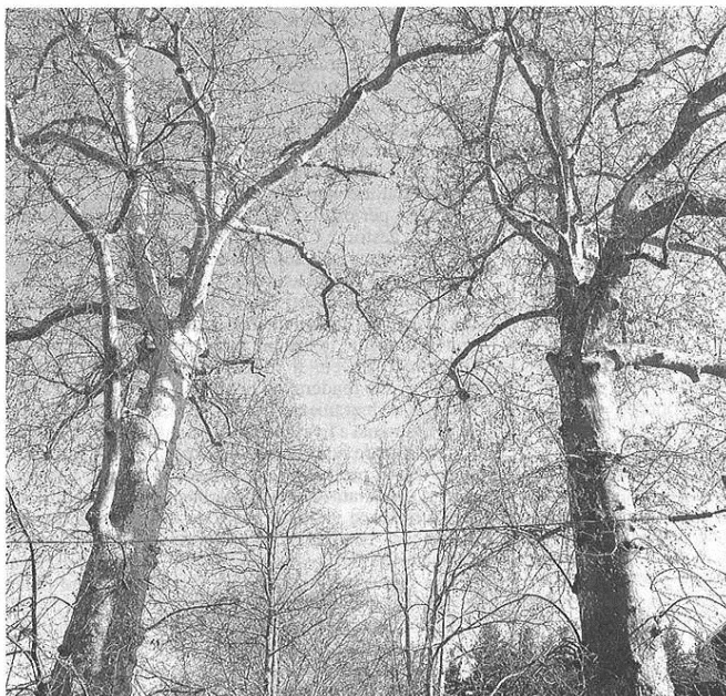
I due platani da abbattere al centro di lunghe controversie tra politici locali