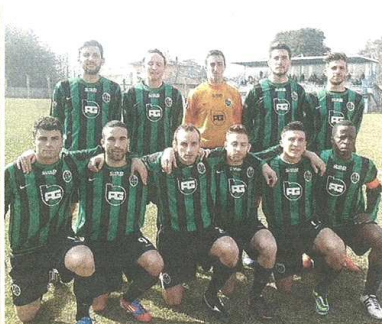
Una spettacolare Valceresio ha rifilato ben quattro reti alla capolista Castellanzese in una partita già chiusa dopo appena mezz'ora. Per gli ospiti un pomeriggio da dimenticare in fretta