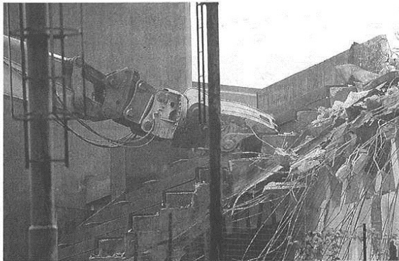
I lavori di demolizione del vecchio oratorio scattati ieri al Buon Gesù