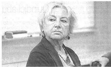
La giornalista Giuliana Sgrena ospite ieri alla Liuc