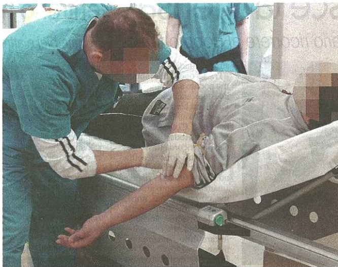
Il caso di un castellanese solleva il problema delle cure che richiedono farmaci particolari