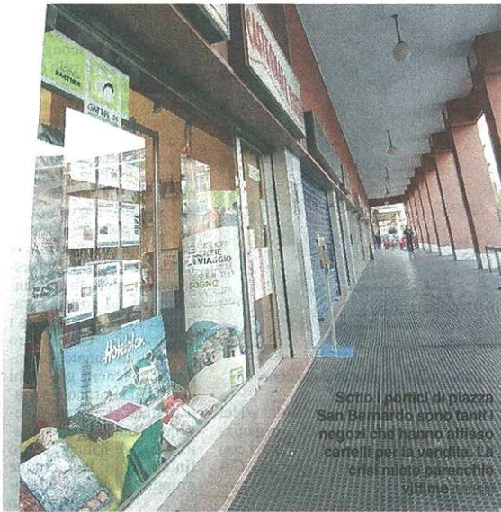
Sotto i portici di piazza San Bernardo sono tanti i negozi che hanno affisso cartelli per la vendita. La crisi mette parecchie vetrine...

Torna il concorso per le vetrine natalizie e compaiono nuove luminarie