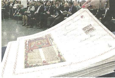
Gli attestati per le borse di studio consegnate ieri alla Liuc VARESPRESS