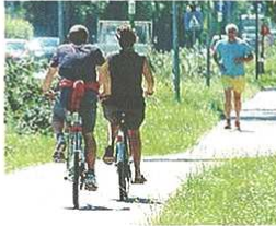
Occhi puntati sulle ciclabili