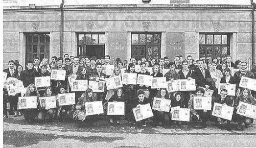
Lo scorso anno gli studenti premiati erano stati 184

gellare l'Altomilanese, bisogna continuare a investire sui giovani. Quest'anno, la Fondazione presieduta da Luigi Caironi ha raccolto un totale di 257mila euro , che serviranno per finanziare gli studi di altri 168 ragazzi . Gli studenti selezionati frequentano le scuole supe-