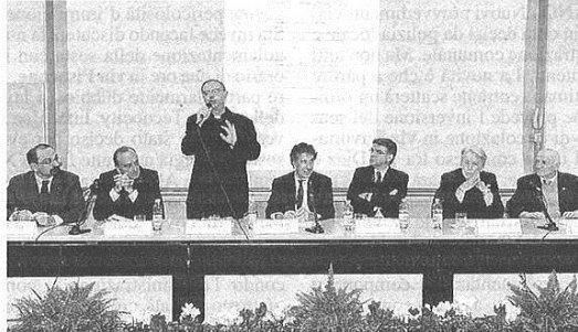
Il palco della "Giornata dello studente" 2013

Per questo oggi in una sede prestigiosa come quella della Liuc - Università Cattaneo di Castellanza sarà celebrata la 28esima Giornata dello studente. La "Giornata" nasce da un'intuizione avuta 31 anni fa, quando da una costola della Famiglia Legnanese nacque la Fondazione. Obiettivo era quello di raccogliere l'eredità di Giovanni da Legnano , giureconsulto vissuto nel XIV secolo che nel suo testamento aveva previsto dei lasciti a favore degli studenti meritevoli e bisognosi. Da allora, la Fondazione ha erogato 3.137 borse di studio , per un totale di 5 milioni e 646mila euro. Soldi che raccolti da istituzioni, imprese e benefattori della zona sono stati impegnati per finanziare gli studi di ragazzi che vivono qui, con la convinzione che se a riuscire saranno i migliori, alla fine a guadagnarci sarà l'intero territorio. Ci sono stati anni facili e anni difficili, ma la Fondazione non è mai venuta meno alla sua missione. Anche oggi, che la crisi economica continua a fla-