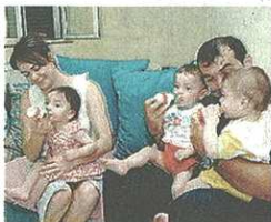
Essere genitori: bello, non facile

L'assessorato alla Cultura e alla Pubblica Istruzione di Castellanza propone una serie di iniziative per comprendere le problematiche della crescita e per focalizzare l'attenzione sul