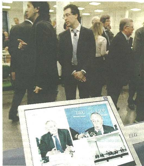
Nell'ambito della Liuc spicca il ruolo formativo della JeLiuc

«Ci sono menti fresche e le idee innovative di chi vuole crescere»