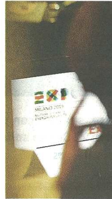
Cibo sano filo conduttore di Expo

Chiudendo con una provocazione, il professor Zizzo si chiede: «Se davvero si vuole far leva fiscale per combattere il sovrappeso e l'obesità - è la domanda - perché non imporre a ciascuno di dichiarare ogni anno la misura del proprio girovita e pagare un tributo commisurato alla eccedenza della misura dichiarata rispetto ad una misura giudicata standard?». ■ V. Des.