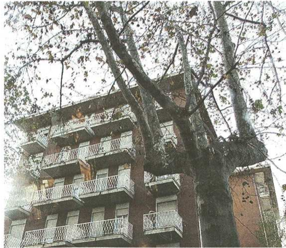
I grandi platani di via don Minzoni minacciano case e residenti. Cresce la paura e la protesta

pubblicato il 19/11/2014 a pag. 30; autore: Stefano Di Maria