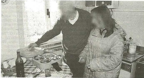
La consegna pasti a domicilio per gli anziani fra i servizi con copertura economica a rischio