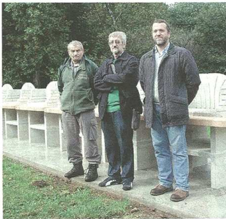
La nuova area riservata ai barbecue