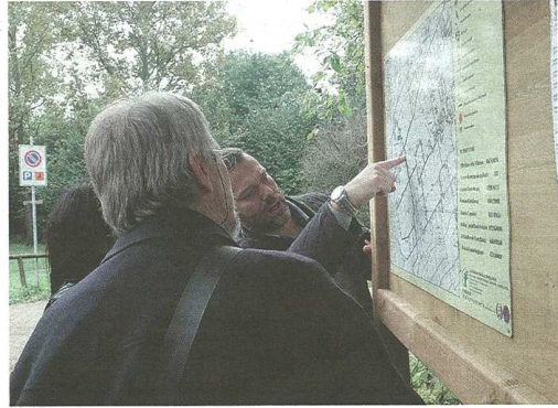
Presentato anche il nuovo percorso ciclabile che collegherà Legnano al Ticino