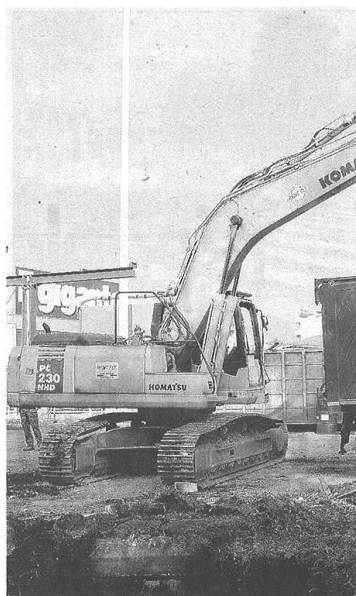
Ruspe al lavoro per smantellare il distributore

Ne nascerà un altro nei paraggi, collegato alla struttura commerciale