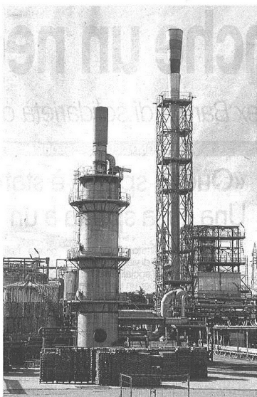
Si apre il dibattito sul futuro dell'ex polo chimico