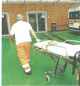
Alla sanità servono ingegneri

Una novità che non ha precedenti nel panorama universitario italiano, offerta in partnership con il San Raffaele di Milano (che