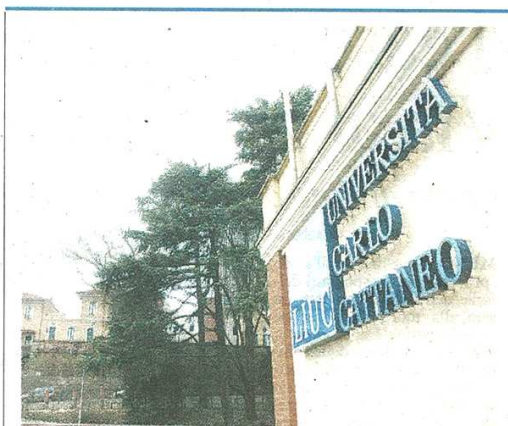
INIZIATIVA La sede dell'Università Cattaneo di Castellanza (Liuc) dove verrà avviato il nuovo coro per professionisti della salute

CASTELLANZA CON IL SAN RAFFAELE DI MILANO