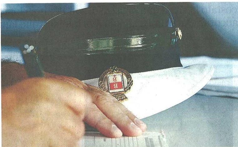
Fioccano le multe tra Busto, Castellanza e Gallarate: gli automobilisti sono ancora troppo indisciplinati

Preoccupante, anche se tutto sommato fisiologico per il sabato sera secondo i comandanti, è il dato sull'alcol-test: circa un conducente su venti (11 in tutto su 234 test somministrati) è risultato positivo al con-