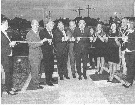
Taglio del nastro, ieri, al nuovo Paglini Renault Store

Inaugurata ieri la moderna e ampia sede che propone i marchi Renault e Dacia