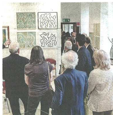
Alcune delle opere esposte alla Liuc (Blitz)

pubblicato il 16/04/2015 a pag. 31; autore: Carlo Colombo