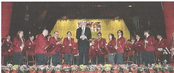
Il corpo musicale Santa Cecilia di Castellanza