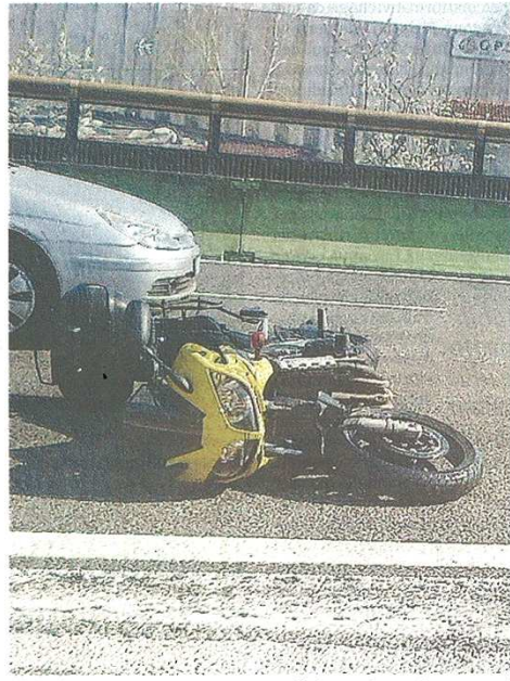
Troppi incidenti in A8: ieri moto a terra all'altezza di Castellanza

«Oggi non ci sono riscontri che possano farci dire come quel quadro indicato dal piano della mobilità sia mutato in modo particolare - commenta il sindaco Farioli - pur essendoci stato un indubbio miglioramento al livello infrastrutturale, sia stradale che ferroviario, credo che nell'ambito della ridefinizione delle competenze di area vasta tra province e città metropolitana debba aprirsi una seria riflessione sul tema della mobilità». Perché è vero che Pedemontana è in fase di realizzazione, ma altre opere alternative alla A8, come il Sempione-bis o la variante della Statale 341, sono rimaste al palo. «È indispensabile un coordinamento di area vasta per limitare gli utilizzi impropri dell'Autolaghi - conviene Farioli - Come? Sviluppando per gli spostamenti interni forme più efficaci di mobilità pubblica e coordinando gli interventi infrastrutturali». ■