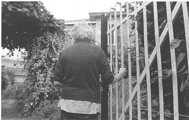
Sempre più spesso gli anziani che vivono soli finiscono nel mirino dei truffatori

Il colpo che ha fruttato di più è stato messo a segno in via Lombroso, dove un falso venditore di santini di Natale è prima ha fatto visita a una famiglia, dove ha rinunciato alla razzia per la presenza di troppe persone, e poi ha preso di mira un settantottenne che in quel momento si trova-