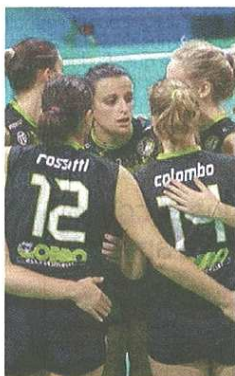
La gioia di Castellanza dopo il netto successo ai danni di Orago