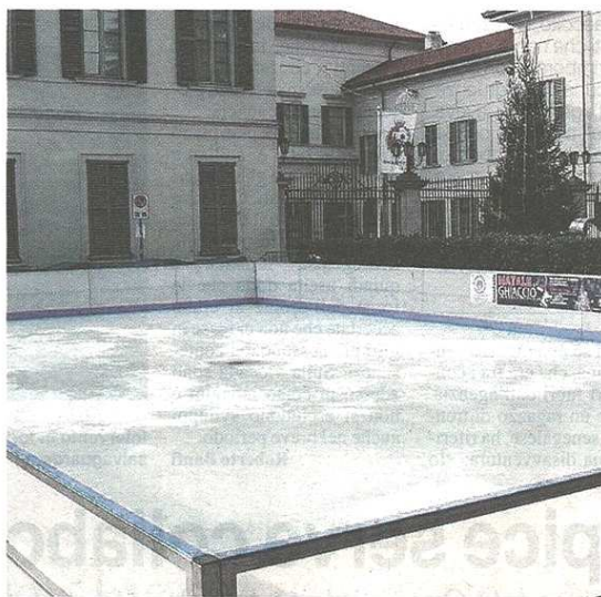
Durante la notte la pista di ghiaccio è stata ricoperta di sale