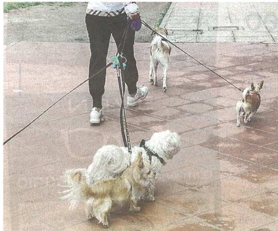
I cartelli indicano il divieto di portare i cani alla Corte del Ciliegio. A Castellanza in tanti circolano con i quattrozampe senza sacchetti

pubblicato il 09/12/2015 a pag. 32; autore: Stefano Di Maria