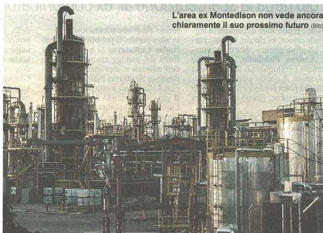
L'area ex Montedison non vede ancora chiaramente il suo prossimo futuro (BIRZ)

pubblicato il 05/12/2015 a pag. 32; autore: Stefano Di Maria