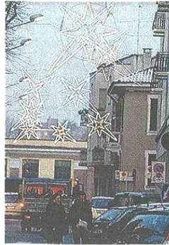
Aria di Natale in città ARCHIVIO

Al Teatro di via Dante andranno in scena "Una tata praticamente perfetta" (19 dicembre), occasione per raccogliere fondi per la ricerca sulla leucemia in-