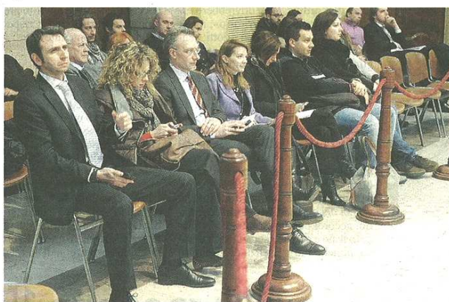
Gli esponenti del Comitato pendolari Busto Nord l'altra sera in municipio

«Non ho voluto intervenire - spiega Montagnoli - ma il servizio ai cittadini è pessimo: bisogna dare un segnale sia a Trenord sia a Trenitalia, visto che da noi, sulla Domodossola-Milano, i treni arrivano e non arrivano, vengono soppressi all'ultimo momento e la gente non sa mai se può contare sul servizio. Assurdo che un treno venga sospeso o non si fermi perché troppo pie-