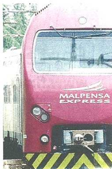
Il Malpensa Express

Ora i pendolari attendono la proposta risolutiva di nuovo orario «su cui l'assessore Sorte sta lavorando per ovviare a quella che sarebbe una iattura per i pendolari e per il territorio», come annunciato dal consigliere regionale di Forza Italia Luca Marsico , e che dovrebbe arriva-