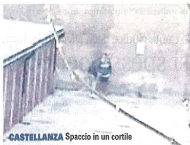
CASTELLANZA Spaccio in un cortile