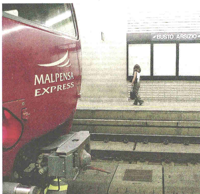
Il Malpensa Express entra nella stazione di Busto Nord: un'immagine che farà parte del passato?

Così perderemmo il nostro ruolo di "porta" dell'aeroporto»