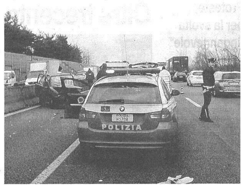
L'incidente è avvenuto nei pressi dello svincolo di Legnano

pubblicato il 15/01/2015 a pag. 38; autore: Luigi Crespi