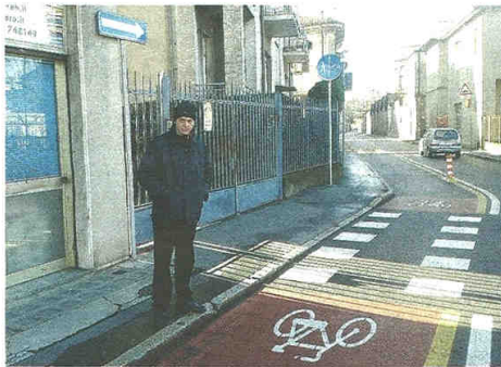
La pista ciclabile di via Pomini è poco gradita a tutti

Concordano l'edicolante e la barista, che lamentano un sensibile calo di vendite «perché il traffico è diminuito parecchio». Ma non è solo una questione di soldi: «Basta piazzarsi qui per rendersi conto che la pista non la usa quasi nessuno - affermano - Addirittura si vedono i ciclisti transitare a destra, sull'altro lato». C'è anche chi segnala l'alta velocità, «perché via Pomini è ormai un rettili-