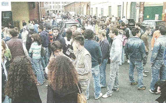
Gli studenti Liuc possono contare su un mix tra docenti più anziani e giovani