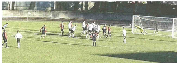
Bridaroli firma su calcio di punizione il gol del raddoppio del Maslianico Sopra Ba centra la traversa su rigore: il pallone rimbalza al di qua della linea