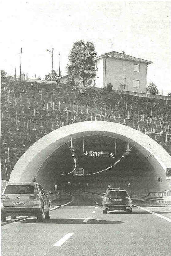
Uno degli imbocchi del tunnel a due canne che causerebbe disagi e danni ai residenti del rione di Solbiello. «Chiediamo risposte concrete»

I residenti di Solbiello lamentano danni alle abitazioni: sotto passa la galleria