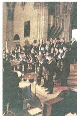
CONCERTO NATALIZIO Gli esecutori e parte del pubblico