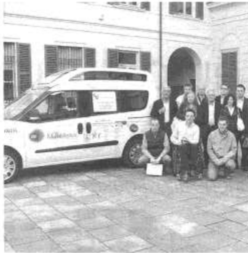
La prudenza non è mai troppa, ma questa volta non ci sono truffe