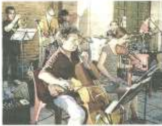
Uno degli eventi musicali della Notte bianca.

giochi e divertimenti per bambini, giovani e adulti. Un miscuglio di attività e attrazioni. La giornata è iniziata sabato pomeriggio con le attività di fitness all'aperto, bancarelle gastronomiche, hobbyisti, giochi gonfiabili e animazione