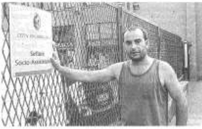
Il padre di famiglia è rimasto tutto il giorno davanti ai Servizi Sociali

CASTELLANZA - Marito, moglie e figli, sfrattati dalla casa dove vivevano, si sono rivolti ai Servizi sociali. Ne è nato un momento di tensione e sono dovuti intervenire vigili e carabinieri.