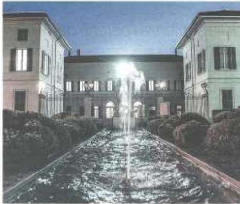
La Valle Olona si scaglia contro Palazzo Brambilla che ha scelto Busto Arsizio