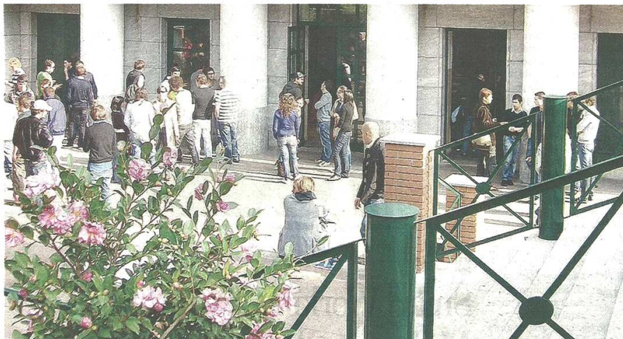
L'incontro "Industry 4.0, il viaggio verso la Smart Factory" è stato organizzato dal Lab#ID della Liuc

In questo senso, la tecnologia 3D, le stampanti tridimensionali di nuova generazione hanno rivoluzionato il modo di fare impresa; una rivoluzione che ha permesso di aumentare la qualità del prodotto e di abbassare i costi, trasferendo la tecnologia dal prodotto stesso alla conoscenza. Precursore