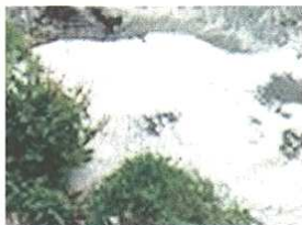
La schiuma nell'Olona

VALLE OLONA (pil) La schiuma è tornata nelle acque dell'Olona. E' accaduto nel fine settimana quando alcune chiazze bianche sono comparse In Valle nel tratto da Fagnano Olona e fino quasi a Legnano. Invece nel fine settimana ecco di nuovo comparire le chiazze bianche nel tratto da Fagnano Olona e fin quasi a Legnano. A dare l'allarme è stata una delle sentinelle volontarie di Leg-