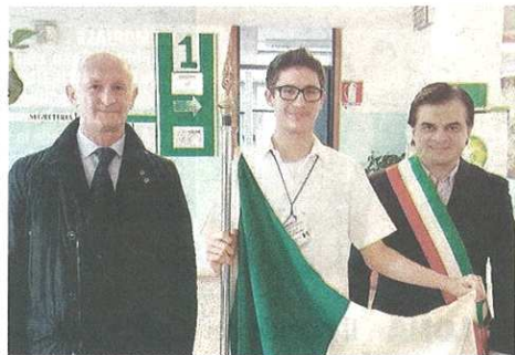
Alcuni momenti della cerimonia per la Giornata dell'Unità D'Italia organizzata mercoledì all'istituto comprensivo