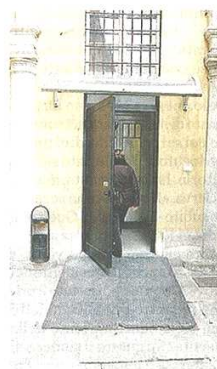
Dura la vita per ottenere una pratica a Palazzo Gilardoni