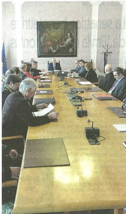
I sindaci dal prefetto Zanzi mercoledì 18 marzo

pubblicato il 20/03/2015 a pag. 30; autore: Veronica Deriu