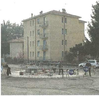
È ora percorribile la rotatoria di via Rescalda

La soddisfazione dell'assessore Frigoli: «Manca la segnalnetica, poi tutto perfetto»