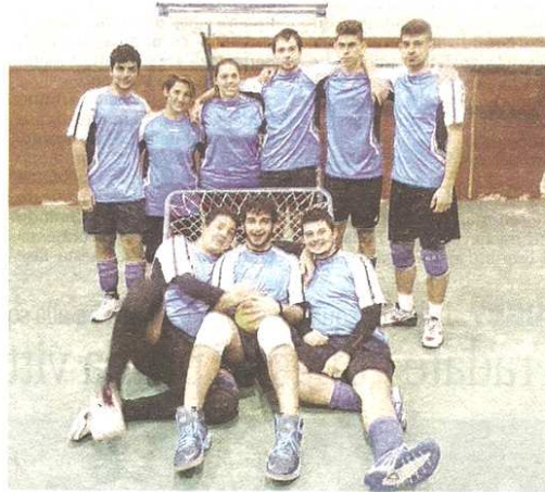
La squadra dei Caronno Sharks è al comando della classifica di serie B sin dalla prima giornata

Caronno Sharks (13) 24, Solaro Sparks (14) 22, Torino-