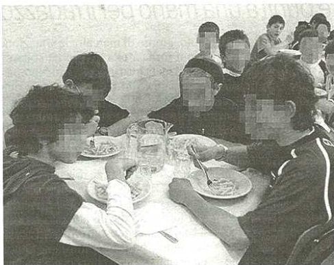
La situazione dei pagamenti va migliorando (Blitz)