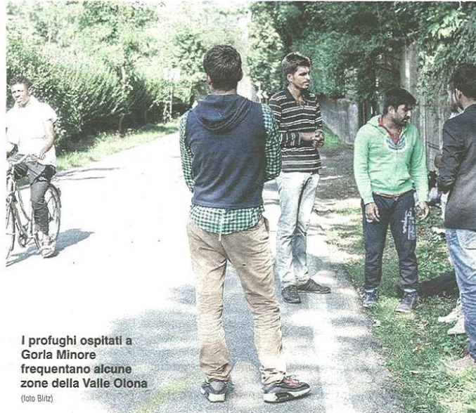
I profughi ospitati a Gorla Minore frequentano alcune zone della Valle Olona