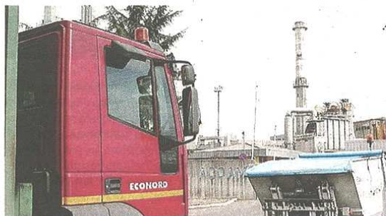
L'inceneritore Accam di Borsano sotto accusa per l'inquinamento Archivio

dell'incontro in programma l'8 settembre per esporre lo studio epidemiologico delle Ats su Accam, il gruppo del Movimento Cinque Stelle di Busto suggerisce, da un lato, che l'incontro sia «aperto al pubblico», in quanto viene ritenuto «doveroso rendere partecipi i cittadini su argomenti che riguardano la loro salute», ma dall'altro anche che