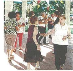
La Colonia Elioterapica Archivio

concludere la serata all'insegna del divertimento, ci sono i dehors in piazza San Giovanni pronti per sfornare gli aperitivi dopo le immane "vasche" in centro. E poi è grande festa, addirittura in maschera, al "Latinfieppo", il festival latinoamericano di Malpensafiere, che propone un'apertura straordinaria all'insegna dell'esotico "Carnival Tropical Party", una novità assoluta alle nostre latitudini. Insomma, a Ferrago-