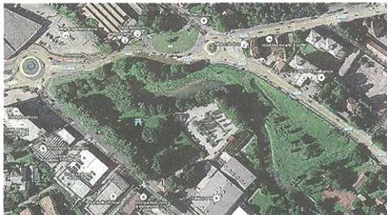
Castellanza rientrerà a far parte dell'Azienda Speciale Medio Olona Archivio

Del resto l'assenza di Castellanza dal gruppo aveva finito per costituire, in un certo senso, un elemento anomalo. Primo comune della Valle Olona se si viene dall'Altomilanese, primo per numero di abitanti; è il comune che negli anni ha saputo essere elemento di coagulo per le realtà vallive. Un raccordo che ha condotto alla realizzazione di diverse iniziative, tra cui appunto l'Azienda speciale Medio Olona. Il ragionamento è di