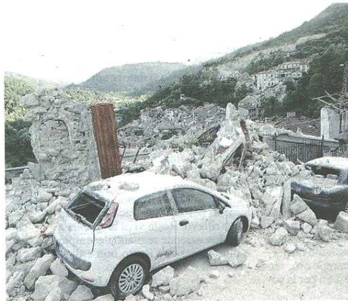
Un'immagine simbolo dei danni generati del terribile sisma

Compatti e uniti per la solidarietà, gli amministratori locali anche questa volta si sono messi a disposizione rispondendo pure all'esigenza nata dal basso. «I cittadini ci hanno chiesto un impegno concreto per sostenere le popolazioni colpite dal terremoto: un doppio dovere il nostro», spiega Landoni. «Quindi, anche in questa occasione abbiamo scelto di coordinarci e lavorare insieme, unendo le forze con i volontari della protezione civile che negli anni e anche di fronte ad altre tragedie hanno saputo mettersi a disposizione». Inoltre: «I nostri volontari della Valle, dopo l'esperienza in Emilia, avevano dei contatti e dunque abbiamo scelto questo primo intervento a Montegalloy. Infatti, si sono tutti adoperati per far fronte alle richieste locali proprio su indicazioni dei locali, siamo in