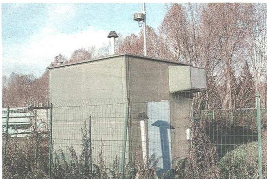
La centralina dell'Arpa si trova in via Novara, poco lontano da Accam

Il sindaco valuta, dunque, il dato legato alla centralina vicina all'Accam in via