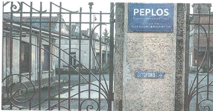
L'area Peplos potrà ospitare un supermercato, creando così posti di lavoro