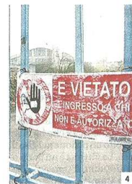
Scheletri 1. Il polo ex Montedison tra Castellanza e Olgiate Olona 2. La famigerata ex cartiera Vita-Mayer a Cairate 3. L'ingresso delle ex Sottrici di Veduggio Olona: il piano di rinascita fa lenti passi avanti 4. La polveriera di Taino, vera e propria cattedrale di cemento nel deserto