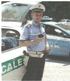
INTERVENTO Un agente al lavoro nell'area colpita dal rogo

pubblicato il 24/06/2016 a pag. 3; autore: Rosella Formenti