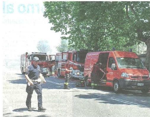
Alcune immagini dell'incendio divampato ieri mattina alla ex Crespi, tra via Monte Lungo e via per Busto Arsizio. Interventati oltre dieci mezzi dei vigili del fuoco: le strade circostanti sono state bloccate