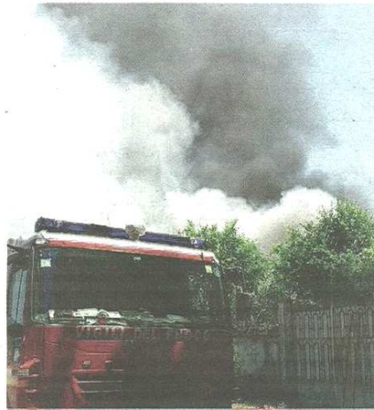
Il fumo è stato portato dal vento in molti comuni

Effettuati campionamenti dell'aria. Raffica di foto sul web