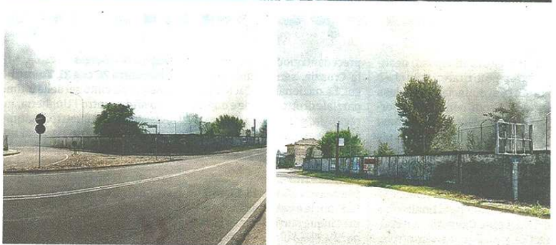
Sono intervenuti sul luogo anche gli specialisti vigili del fuoco, del nucleo regionale N.B.C.R di Milano Varese Press

pubblicato il 24/06/2016 a pag. 27; autore: Pino Vaccaro