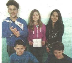
I ragazzi e gli insegnanti impegnati nel progetto