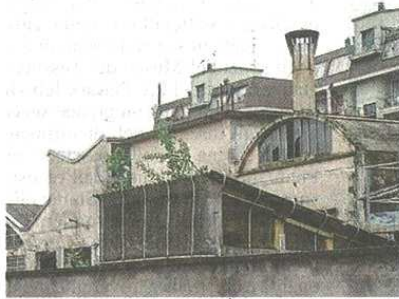
La ex Tintoria: persi i ricorsi contro il discount

Il credito complessivo del Comune verso la proprietà ammonta a 920mila 251,27 euro per one-