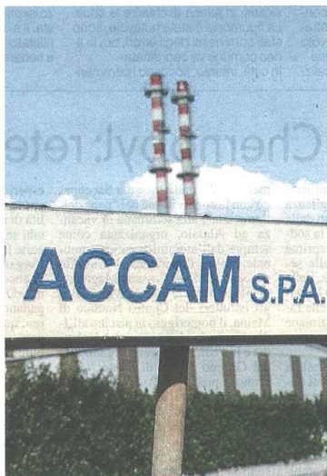
Ancora rinviate le decisioni sul futuro di Accam