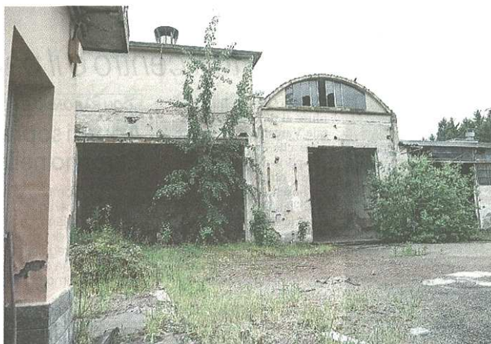
Mentre si discute del suo futuro, la ex Tintoria è sempre più preda del degrado