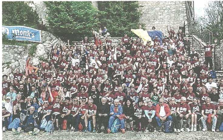
Foto ricordo per i podisti del gruppo Tapascioni al Sacro Monte: appuntamento rispettato come ogni anno

Applausi e sorrisi al traguardo con benedizione di monsignor Villa