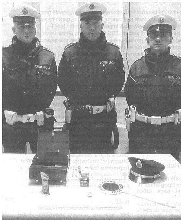
Gli agenti di polizia locale con la cassetta postale usata per lo scambio della droga e sequestrata durante l'operazione di ieri

pubblicato il 11/03/2016 a pag. 31; autore: Stefano Di Maria