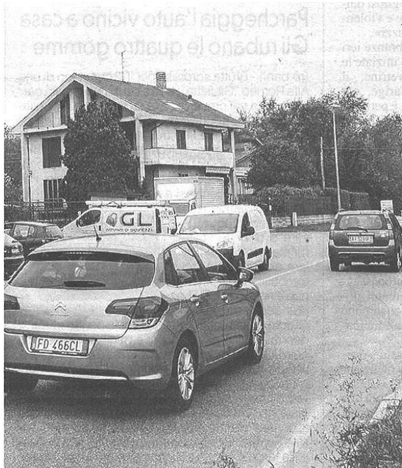
In via don Gnocchi corre il pericolo e l'insicurezza. E c'è chi già prepara una petizione per chiedere di potenziare l'illuminazione pubblica

pubblicato il 03/11/2016 a pag. 37; autore: Stefano Di Maria