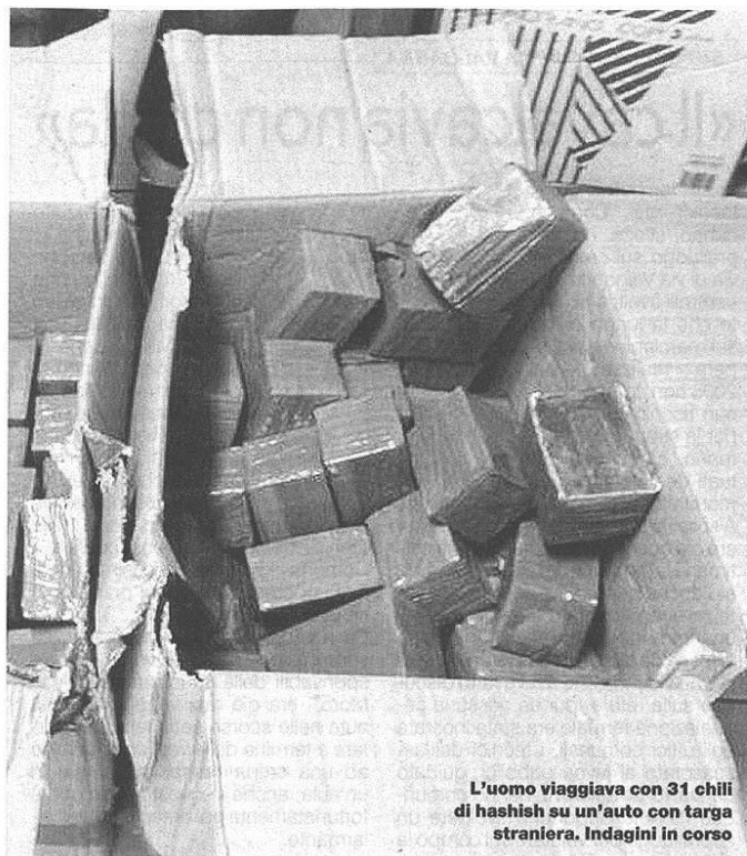
L'uomo viaggiava con 31 chili di hashish su un'auto con targa straniera. Indagini in corso

È accaduto ieri mattina all'uscita dell'A8: viabilità in tilt e disagi