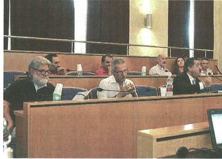
I banchi del consiglio comunale dove siedono i gruppi di minoranza

Mercoledì mattina una parte dell'opposizione, Movimento 5 Stelle, Sinistra Legnanese e Per Legnano, ha rilanciato una serie di temi durante una conferenza stampa congiunta.