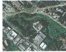
La zona del bosco da Google Maps