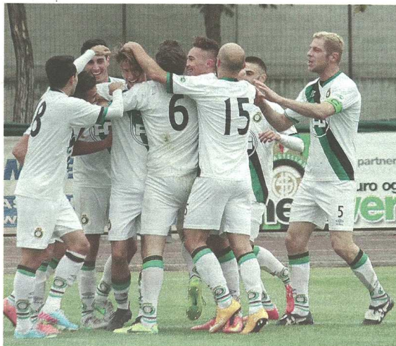
È sempre festa per la Castellanzese: k.o. una tonica Castanese