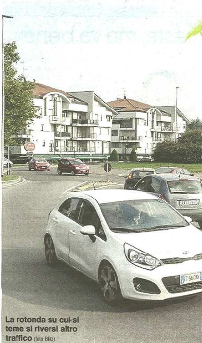
La rotonda su cui si teme si riversi altro traffico

pubblicato il 09/10/2016 a pag. 31; autore: Stefano Di Maria